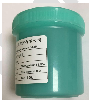
图1 产品之包装形态